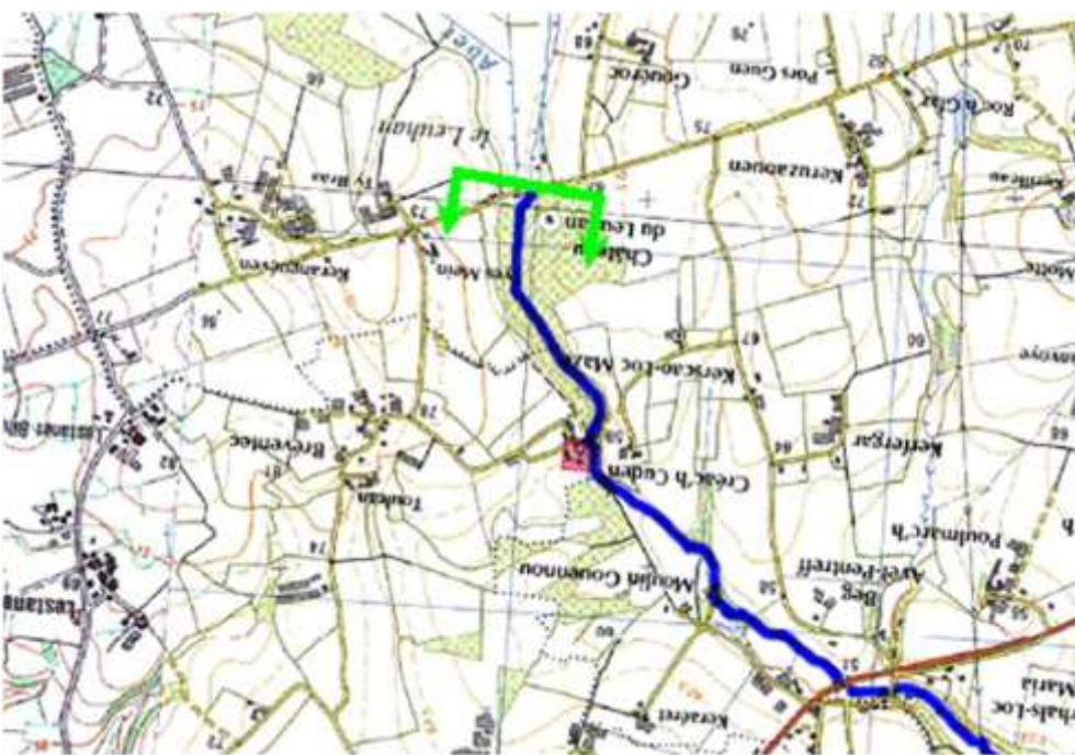
De la partie maritime jusqu'au château du Leuhan, sur la route Plabennec - Ploudaniel, commune de Plabennec.